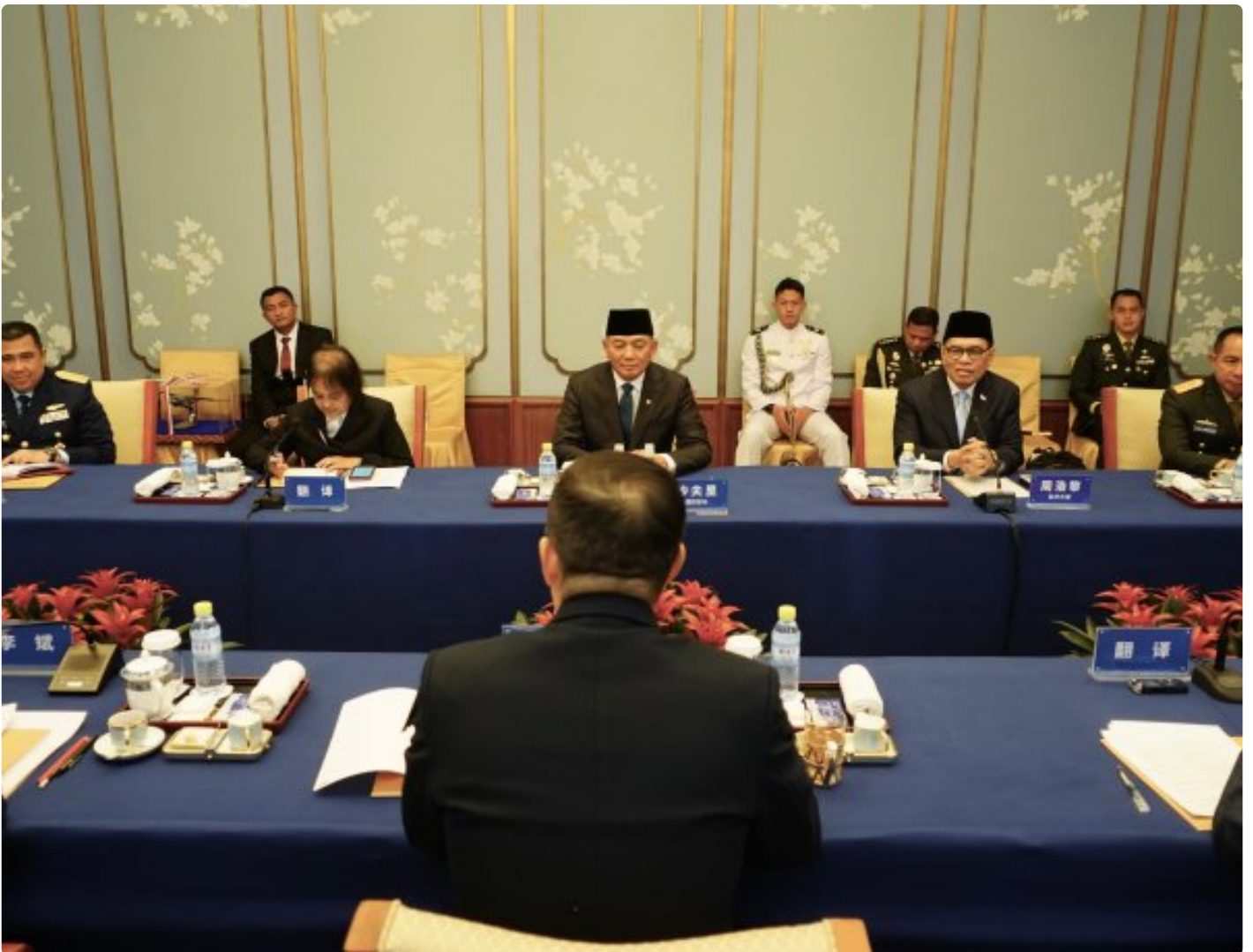
RRT - Panglima TNI Jenderal TNI Agus Subiyanto mendampingi Menteri Pertahanan Republik Indonesia Sjafrie Sjamsoeddin dalam kunjungan